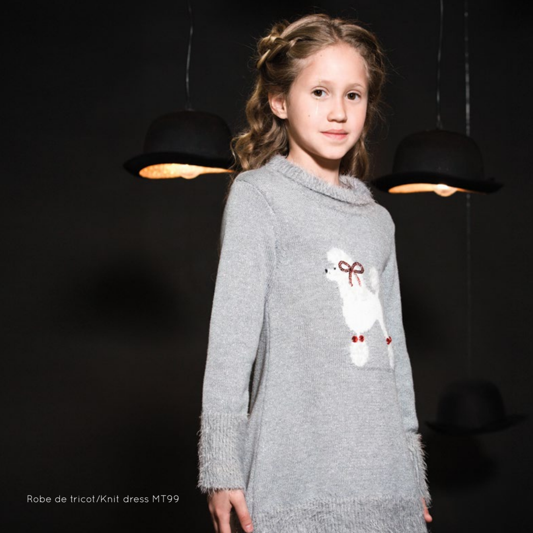
Robe de tricot/Knit dress MT99