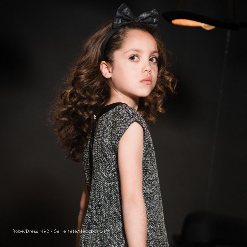
Robe/Dress M92 / Serre-tête/Headband M81